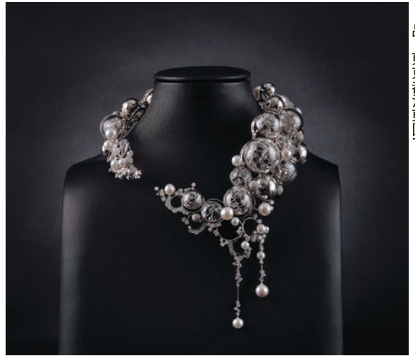
内閣総理大臣賞と 技術賞に輝いた西村さんの作品 品 東京都江東区で