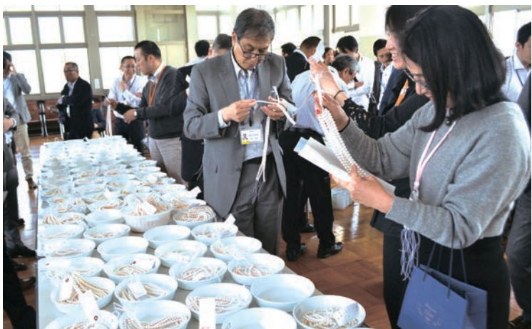
真珠製品を値踏みする小売店や卸業者などの参加者ら＝伊勢市岩渕で