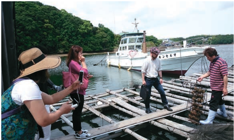
いかだ上で養殖中の真珠母貝を見ながら解説を聞く中国人バイヤー(左)ら＝志摩市阿児町神明の坂口真珠養殖場で

【伊勢】伊勢市岩渕二丁目の真珠会館で四月十三日と十四日、国内最大規模の真珠製品の入札会、AJPA (All Japan Pearl Association) 入札会が開かれた。東京、神戸、伊勢志摩で入札会を開催している8団体が合同で開催。真珠養殖発祥の地、伊勢志摩で業界を盛り上げようと二年前から毎年開いている。真珠製品のメーカーがネ