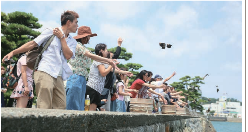
アコヤ貝を放流する観光客と職員＝鳥羽市鳥羽1丁目のミキモト真珠島で